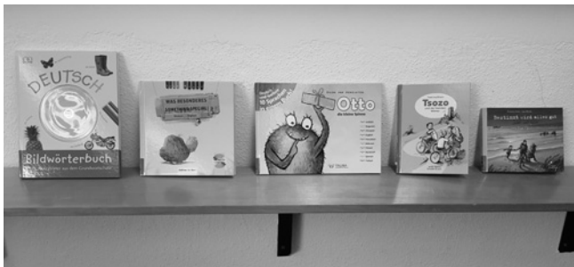
Bücher zum Thema „Neu in einem fremden Land“

Die Flüchtlingsdiskussion bewegt nicht nur Erwachsene. Auch Kinder verfolgen das Thema Flüchtlinge in den Medien und haben Fragen dazu. In der Gemeindebücherei gibt es einige Bilder- und Kinderbücher, die das Thema „Neu in einem fremden Land“ aufgreifen und auch schon für jüngere Kinder geeignet sind.